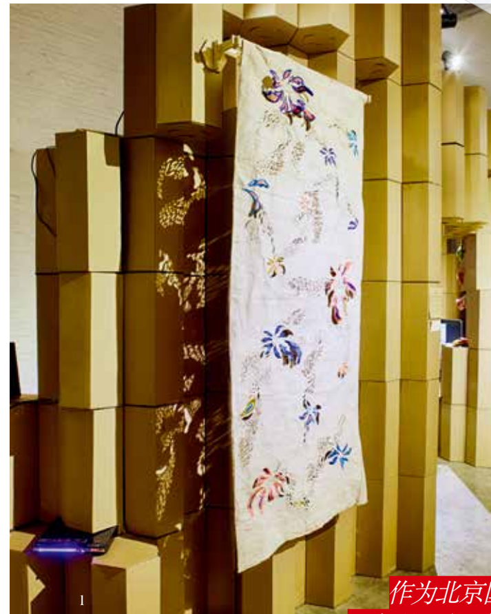
作为北京国际设计周延续两年的展场,草场地的展览一向以艺术性和实验性见长。

所谓临时建筑,顾名思义,是一个暂时存在的建筑物。在当今社会,实现公共艺术已经是一件很困难的事情,用完即扔更是一种巨大浪费。这个临时舞台由模数化设计开始,由实现不同功能的“单体功能块”在空间中的有序延伸和复制形成建筑体,在活动结束之后,“功能块”作为可以单独使用的部件,可以被人们购买和收藏,也是一种可持续精神的宣扬。